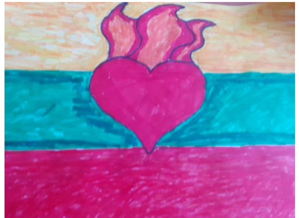
Benas Gudauskas, 6b klasė