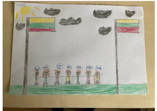
Lukas Genupskis, 6g klasė