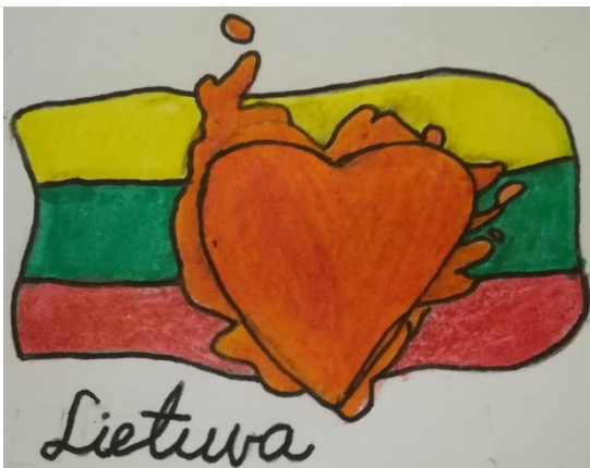
Mia Serepinaitytė, 6g klasė