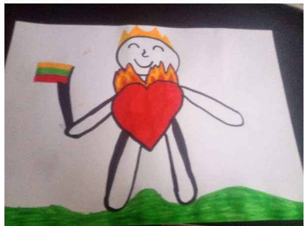
Emilijus Breitaris, 6b klasė