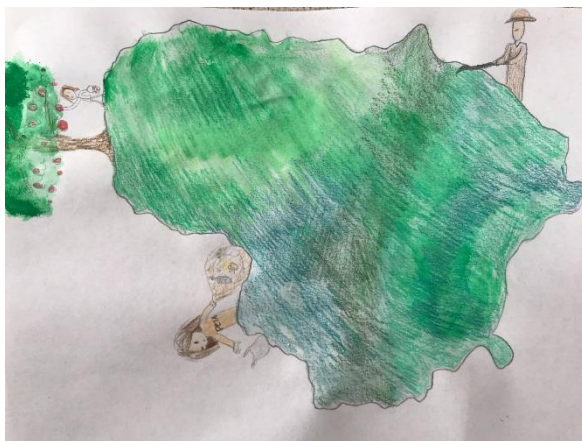
Vaiva Šliauderytė, 6b klasė