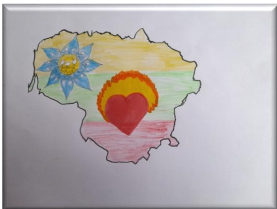
Dovydas Stankus, 6b klasė