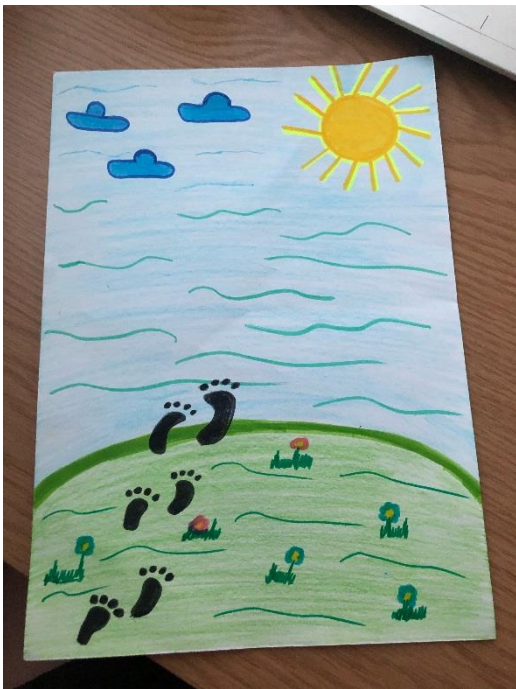
Goda Gaidamavičiūtė, 6b klasė