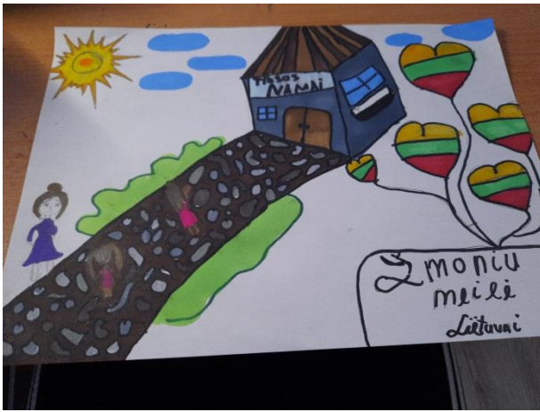
Gabija Beniušytė, 6b klasė