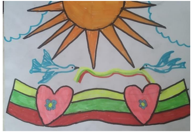
Giedrius Sadauskas, 6g klasė